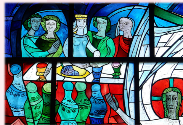
Pfarrbriefservice: Bild, Friedbert Simon - künstl. Gestaltung Erich Schickling

Glauben heute zwischen Aufgeklärtheit und Naivität