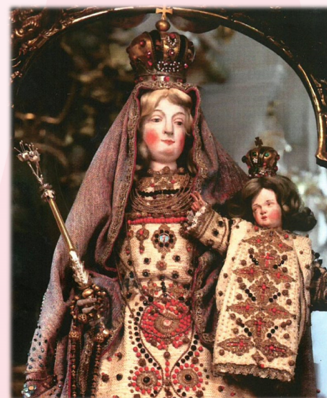
Gnadenbild Wallfahrtskirche Maria Brunnlein, Wemding