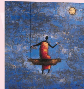
(Gemälde von Michel Rauscher)

ihre Sprache, ihre Botschaften und was sie uns abverlangt