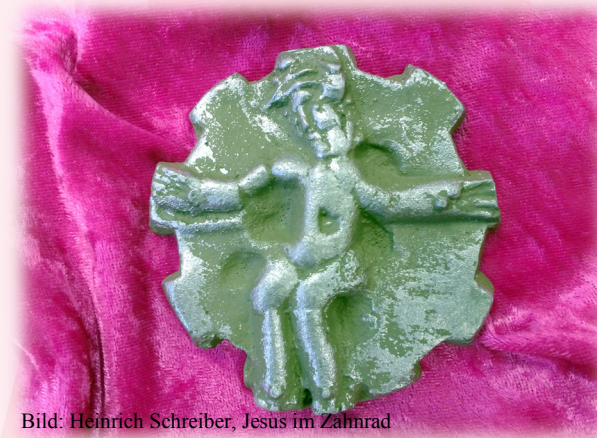
Jesus im Zahnrad